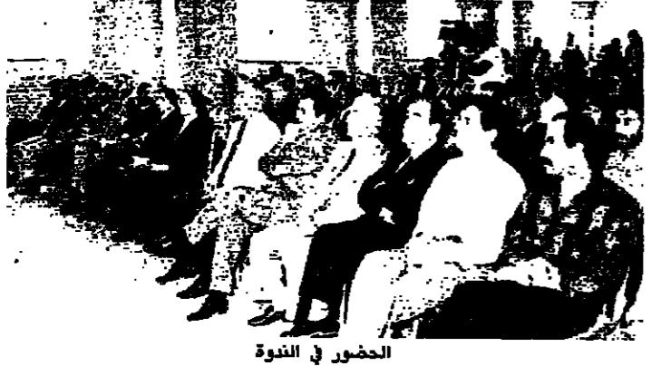
الحضور في الندوة